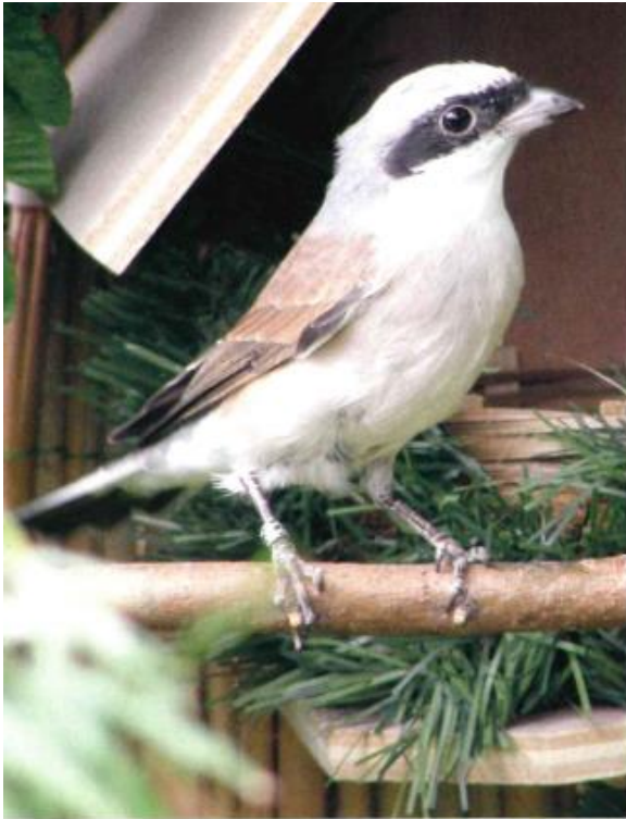
grauwe klauwier man voor aangeboden nest