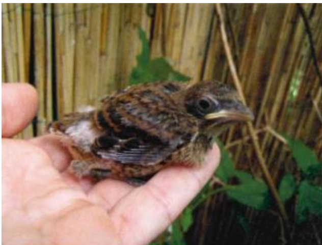
grauwe klauwier ong 10 dagen oud

voortdurend van haar nest af. Toen ze beide aan de andere kant van de volière ruzieden, nam ik eventjes ten kijkje in het nest en daar zag ik twee jongen liggen. Meteen een foto gemaakt want wellicht kreeg ik deze kans nooit meer. De jongen waren echt zeer lichtroze en wat direct opviel waren de donkerblauwe oogdoppen en het feit dat de vogels totaal geen dons vertoonden. Ik heb die vrijdag de zesde juni alles aan de kant gegooid en ben gaan observeren. Al snel kwam ik tot de conclusie dat de man apart gezet moest worden ik ving hem toen ook uit, mensen, constateren is 1 ding, correct op gedrag inspringen en handelen is 2. Ik zag namelijk dat de man het nest verdedigde tegen de pop, als deze voer ging halen voor haar jongen en vervolgens kon ze niet voeren, omdat de man haar steeds wegjoeg. De man kreeg een kooitje voor zichzelf dat ik wel bij de pop in de kooi had laten staan. Misschien was het later nodig de man er weer bij te plaatsen, als de pop de jongen niet alleen groot kon kregen en het onderlinge contact tussen man en pop meest dus op deze manier gegarandeerd bleven. De pop deed het echter perfect en de inzet van de man kwam niet aan de orde. Op 7 juni kwamen de overige bevruchte eieren uit. Het voer dat de pop het liefste voerde bestond uit witte meelwormen, witte wasmotten, witte pinky's, witte motten/nachtvlinders, m a.w.