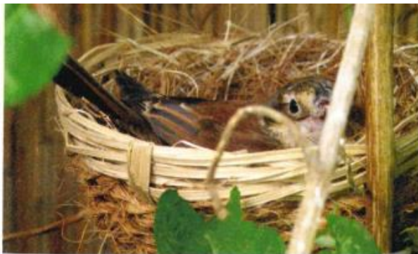
pop grauwe klauwier op nest

Op 1 mei de vogels aan elkaar gekoppeld hoewel ik geen enkele toenaderingspoging zag bij een van beide. Het ging er hard aan toe, moet ik u zeggen, maar na wat "gevechten" werd het stiller en beide vogels wisten hun plek in de volière. Uit voorzorg wel een extra voerplek ingericht, want anders zou