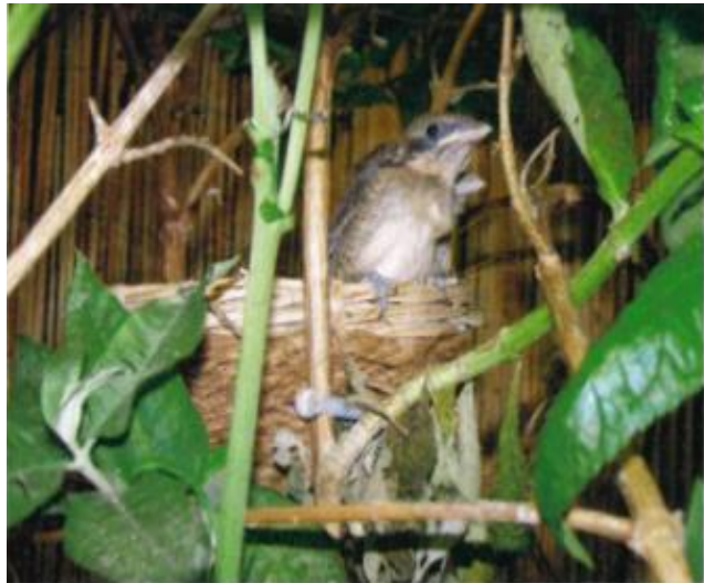
grauwe klauwieren op punt van uitvliegen

werd want dan kwamen ze allemaal als “gekken” op de pop af. Omdat de pop het in haar eentje moest klaren, heb ik de jongen nooit uitgevangen. Dus ik kan u niet vertellen op welke leeftijd dit zou moeten gebeuren, als u nog een ronde zou willen, ikzelf vond 5 jongen meer dan genoeg en ik vond dat de pop haar ouderlijke taken zo voortreffelijk had gedaan, dat ze van mij haar welverdiende rust kreeg en daarom heb ik de man niet meer los bij haar in de volière gezet. Zoals u op de bijgeleverde foto's kunt zien, lijken de jongen op de pop. Er zijn verschillen te zien bij de jongen, maar of daar de kwalificatie man of pop aan te hangen is? Ik heb maar gewoon DNA-verenanalyse erop losgelaten, zodat iemand die om een pop of man vraagt, deze ook daadwerkelijk krijgt. Uiteraard is het ook mogelijk een jaartje te wachten, zodat ze volledig op kleur kunnen komen.