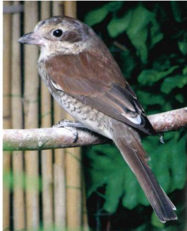
pop grauwe klauwier