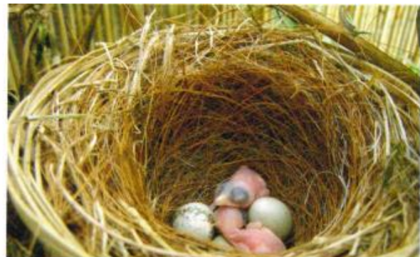
eerste 2 jongen uit het ei

het wel eens tot voedselnijd kunnen komen bij beide vogels.