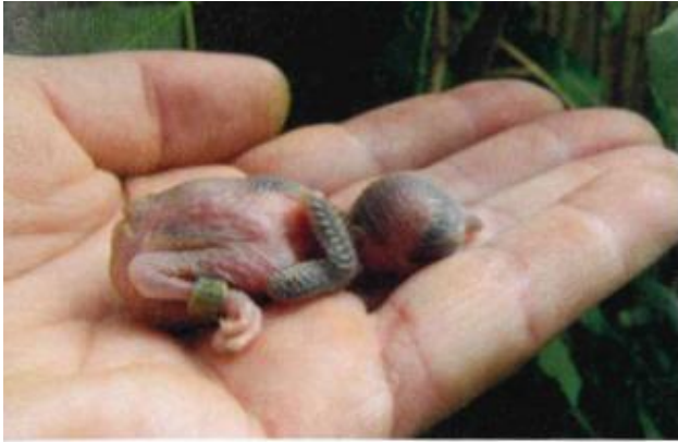
grauwe klauwierjong net geringd

nestmateriaal in het nieuwe aangeboden nest. Zo is eens te meer weer bewezen dat observatie een van de sleutels is tot succes in de kweek. Een andere is natuurlijk de observatiegegevens omzetten in handelen ofwel de vogels "lezen en begrijpen en daarop inspringen". Het aangeboden nestmateriaal bestond uit lange halmen grassoorten, door mijzelf gedroogd), hooi, moe, berkentakjes, kokosvezel, sharpi, dierlijke haren, dunne takjes was zeer nest-vast en maar zelden van het nest te vinden. Op